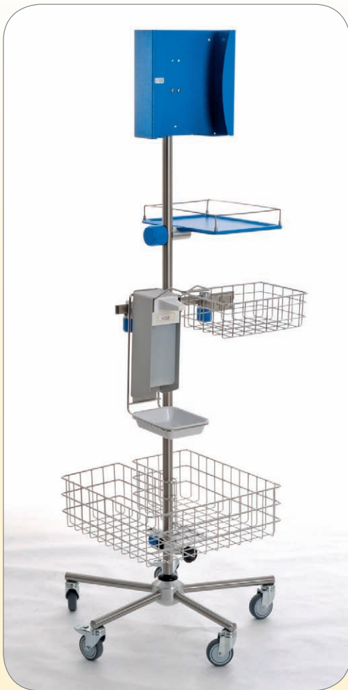
Große Übersicht beim Kombihyg Hygienecenter durch Verwendung von Normschienelementen.

Sie können zwischen 3 Modellen an Hygienezentern wählen. Je nach Anforderungsprofil der jeweiligen internen Hygienevorgaben und deren Umsetzung.